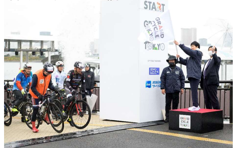
昨年のスタートセレモニーの様子