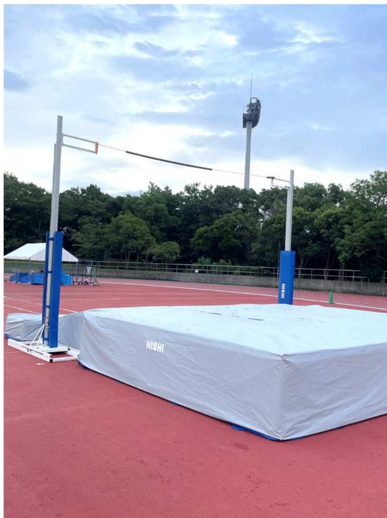
①棒高跳用支柱及びバー止