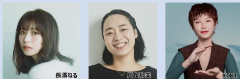
東京2025デフリンピック応援アンバサダー

応援アンバサダーなどを通じ、大会の意義や魅力を伝える。大会エンブレムを用いた広報PRツールの活用、 デフアスリートと子供たちとの交流 や競技体験など、大会への関心を高める取組を幅広く展開。