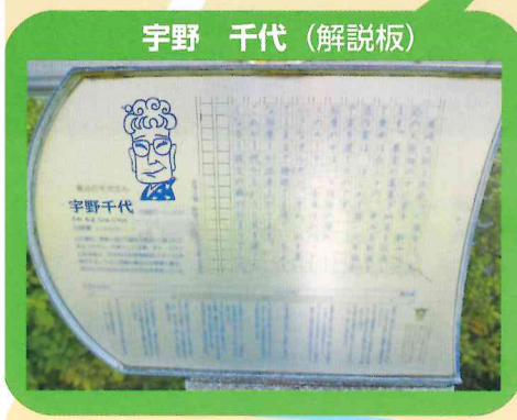
宇野 千代 (解説板)