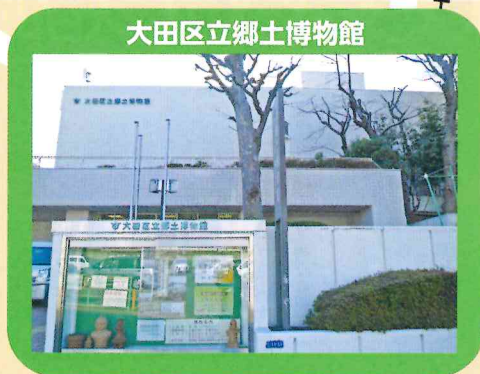
大田区立郷土博物館