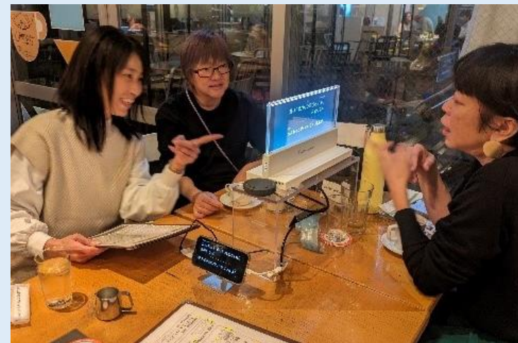
デジタル技術を活用したコミュニケーションを体験できるカフェ (2023年11月15日～11月26日)