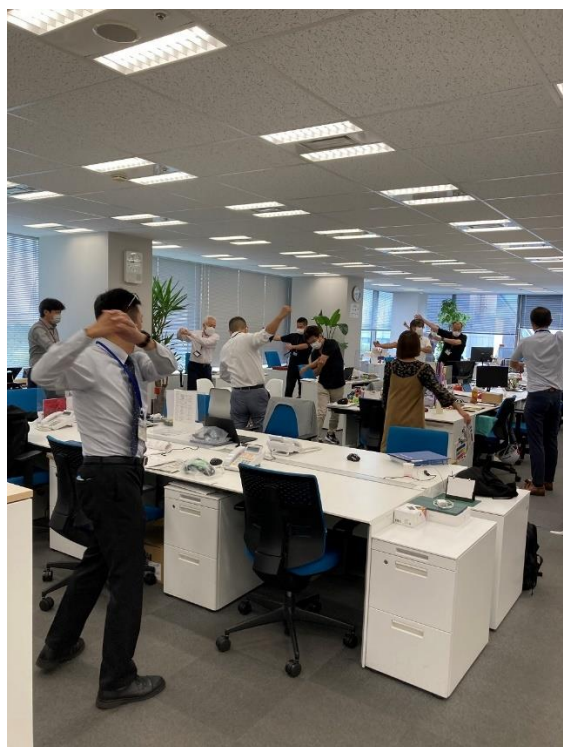
全社で朝のラジオ体操を実施