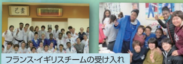
フランス・イギリスチームの受け入れ

その他にも、海外チームの受け入れによる国際交流や、支えてくださる皆様への感謝をこめて、講演活動やイベントへのアスリート派遣など社会貢献活動に取り組んでいる。