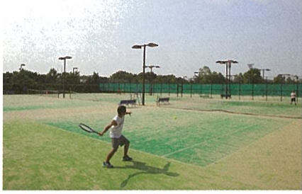
南大沢キャンパス テニスコート

都民が身近なところでスポーツを実施できる場を確保するとともに、東京2020大会等に向け都立スポーツ施設が改修・休館していく中であっても、都民のスポーツ環境を維持できるよう、都内の大学・企業等の体育館やテニスコートなどのスポーツ施設を有償で貸し出していただく事業です。