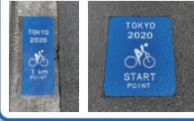
自転車ロードレース(男子/女子)コース(都内)