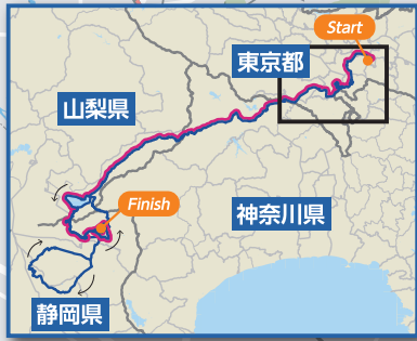
自転車ロードレース(男子/女子)コース(全域)

東京2020大会の記憶や大会の開催意義を後世に伝えるため、自転車競技で走行したロードレースコースの道路上などに、記念マークを設置しました。交通ルールを守って、記憶をたどってみましょう。