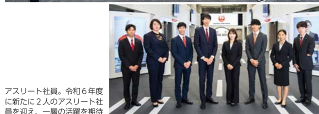
アスリート社員。令和6年度に新たに2人のアスリート社員を迎え、一層の活躍を期待