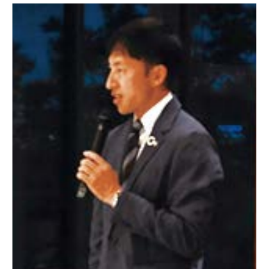
鈴木徹 (パラ陸上 / 走高跳) 企業向けミーティングで講演「障がい者の雇用が進むことこそ、ダイバーシティの実現に不可欠」

全国の地方自治体や、大学、高校、小中学校などからの依頼を受け、障がい者スポーツの普及、障がい者と健常者の共生社会実現に向けた講演や、車いすバスケットボール体験会、義足体験会、デフアスリートによる手話講座など、多数の体験会を実施している。また、多くの障がい者アスリートを雇用する企業として、採用担当者向けに障がい者アスリート雇用についての講演も行うなど、共生社会の実現に向けた発信・取組を積極的に実施している。