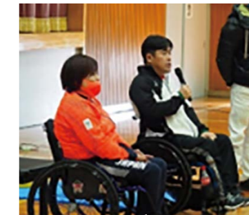
大室秀樹 (パワーリフティング) が岡山県立高校の授業に参加、ベンチプレスも披露