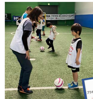
平成28年よりパートナー契約し、ボランティアで参加

経営理念にある「多様性の尊重」及びダイバーシティに対する姿勢と、「視覚障がい者と健常者が当たり前」に混ざり合う社会の実現」という日本ブラインドサッカー協会のビジョンが合致するため、パートナー契約を締結。各大会やキッズトレーニングの運営スタッフとしてボランティア参加している。その他にも、多数の競技団体への協賛を行っている。