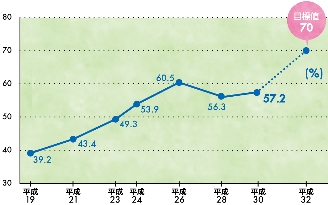
出展:「都民のスポーツ活動・パラリンピックに関する世論調査」

2020年の目標はスポーツ実施率70%達成であり、平成30(2018)年度調査では57.2%となっています。